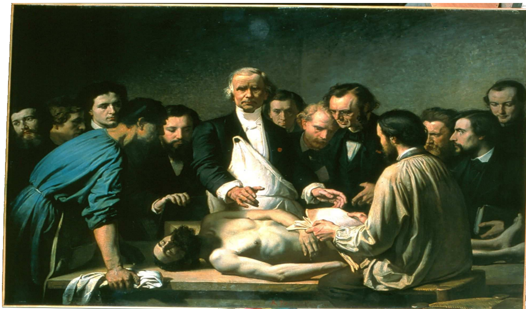
La Leçon d'anatomie de Velpeau à la Charité. Tableau d'Augustin Feytaud (1864).